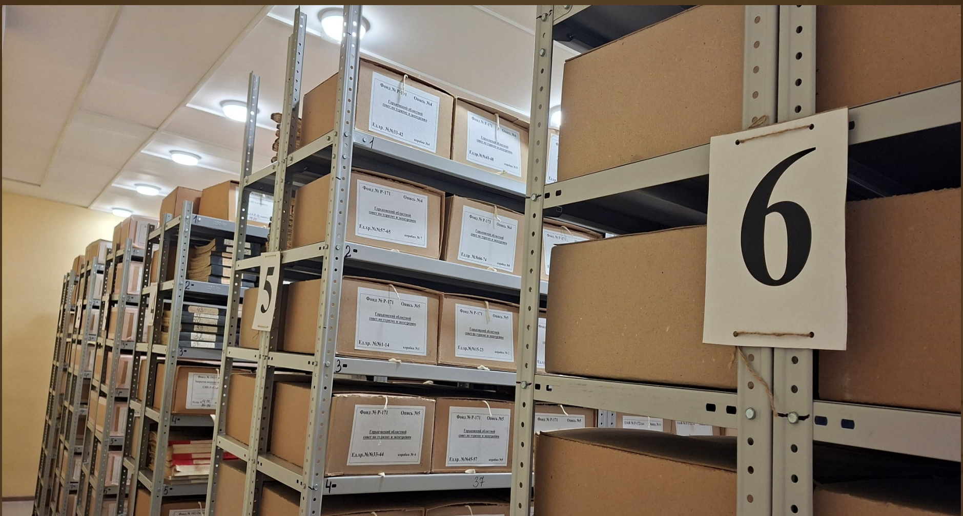
Архивохранилище №1 Помещение №4